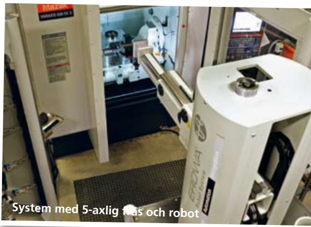
System med 5-axlig fräs och robot

Resinit AB installerar ett helt nytt koncept för effektiv plastbearbetning. En kombinerad 5-axlig fräsmaskin kopplas samman med en robot som plockar material från två magasin. Processen sköts helt automatiskt och kräver endast påfyllning av nya material. Samtidigt ökar efterfrågan på att erbjuda fler kompletterande tjänster utöver själva bearbetningen. Numera sker även montering, lagerhållning och projektledning hos Resinit.