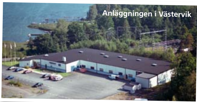
Anläggningen i Västervik

Resinit AB börjar bli trångbodd i sina lokaler som de delar med Bladhs, f.d. Resinit Formsprutning AB. Formsprutningsverksamheten går väldigt bra och de behöver mer produktionsyta. Under året tas beslutet att åter igen bygga en ny anläggning. Denna gång på en helt ny tomt intill Lucernafjärden. Den nya fabriksanläggningen står klar i slutet av året och vid årskiftet flyttas verksamheten dit. Den officiella invigningen sker under sommaren 1999. Resinit AB är fortfarande kvar i denna anläggning. Det året invigs det nya Moderna Museet i Stockholm, trandansen vid Hornborgasjön slår nytt rekord och Sverige blir världsmästare i ishockey för sjunde gången.